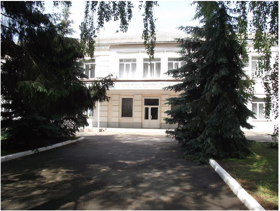
Головний корпус «Академії неперервної освіти»